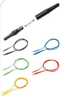
Cavo di prova 2 m con fusibile 10 A CAT IV 1000 V nero / blu / verde / rosso / giallo

WAPRZ002BLBBF10 WAPRZ002BUBBF10 WAPRZ002GRBBF10 WAPRZ002REBBF10 WAPRZ002YEBBF10