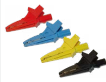
Terminale a coc- codrillo rosso / blu / giallo / nero

WASONREOGB1 WASONBUOGB1 WASONYEOGB1 WASONBLOGB1 WASONBLOGB3