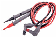
Set di cavi di prova CAT IV, M