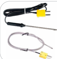
Misura della temperatura