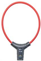
Sensore flessibile F-16