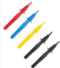
Terminale a puntale (innesto a banana) rosso / blu / giallo / nero B1 / nero B3

WASONREOGB1 WASONBUOGB1 WASONYEOGB1 WASONBLOGB1 WASONBLOGB3