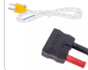
Misura della temperatura